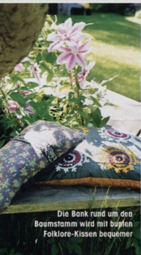
Die Bank rund um den Baumstamm wird mit bunten Folklore-Kissen bequemer