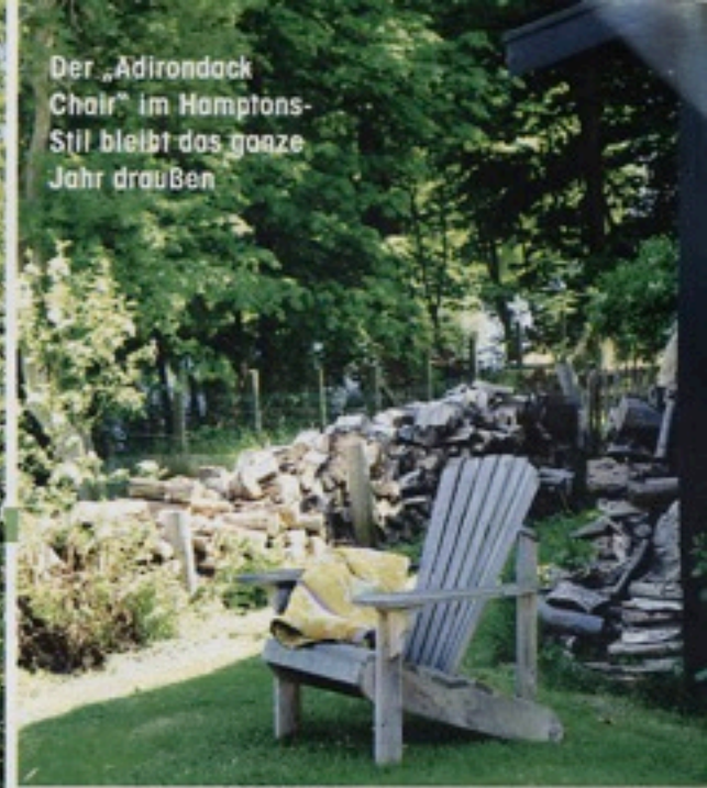
Der „Adirondack Chair“ im Hamptons- Stil bleibt das ganze Jahr draußen