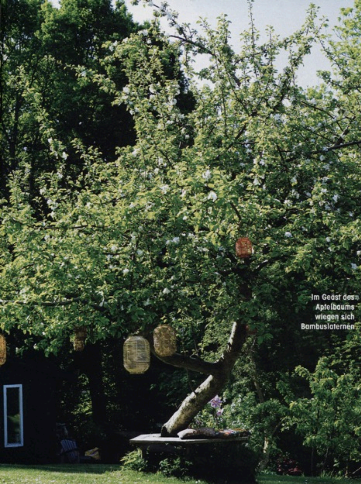
Im Geist des Apfelbaums wiegen sich Bambuslaternen