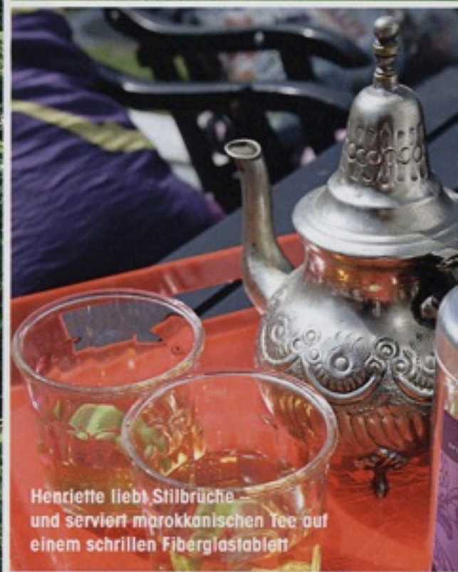
Henriette liebt Stilbrüche und serviert marokkanischen Tee auf einem schrillen Fiberglastablett