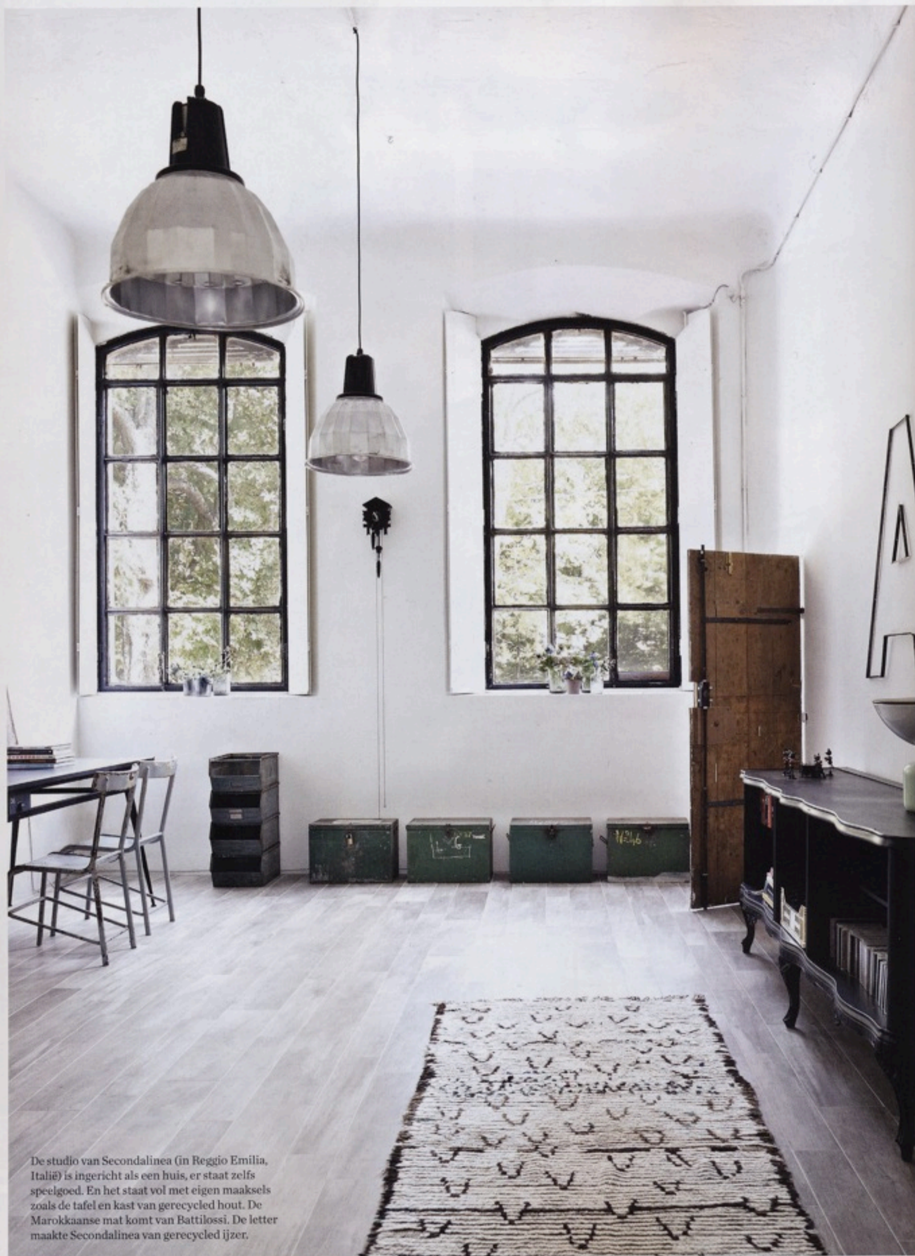
De studio van Secondalinea (in Reggio Emilia, Italië) is ingericht als een huis, er staat zelfs speelgoed. En het staat vol met eigen maakfels zoals de tafel en kast van gerecycleerd hout. De Marokkaanse mat komt van Battilossi. De letter maakte Secondalinea van gerecycleerd ijzer.